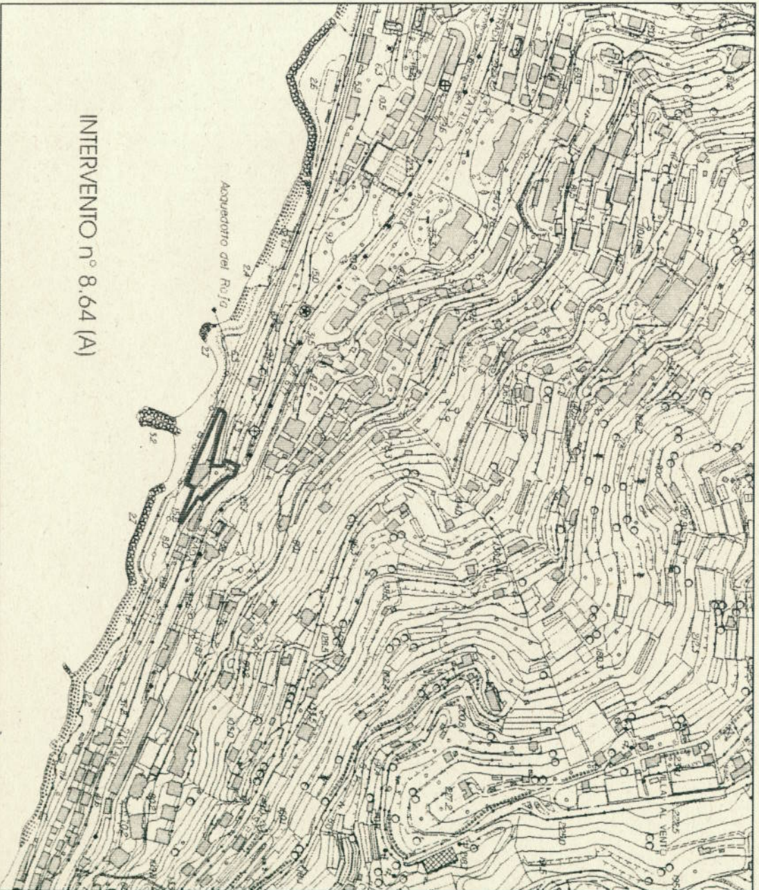
INTERVENTO n° 8.64 (A)

Individuazione preliminare dell'intervento - stralcio CTR scala 1:5.000